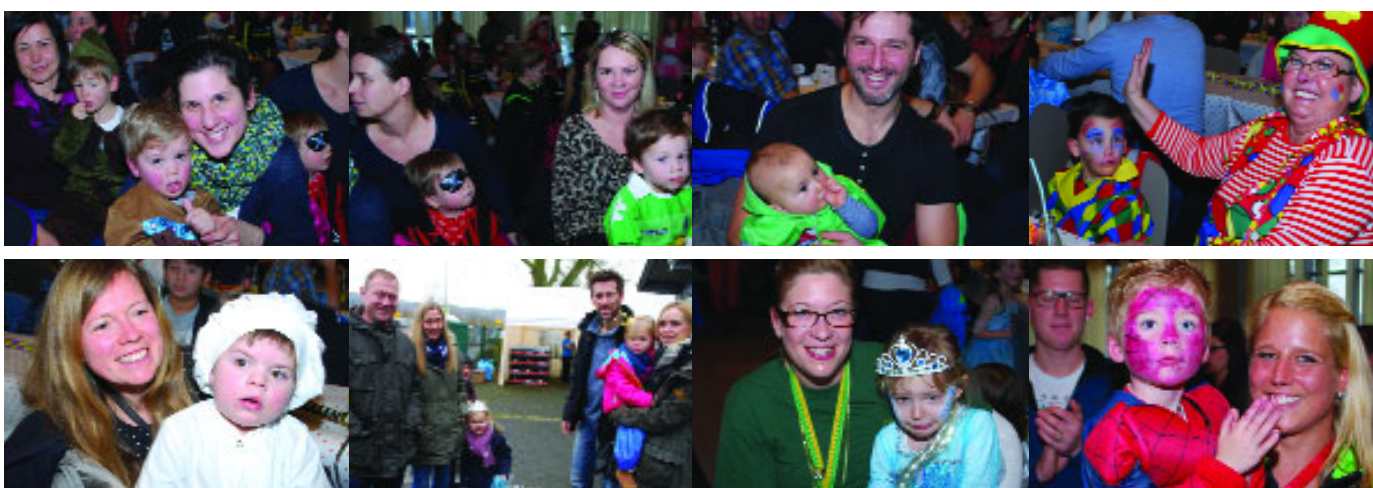
...am 24. Januar bei der Kinderkostümsitzung der Narrenzunft „Grün-Gelb“ in der Aula des Schulzentrums Karthause.