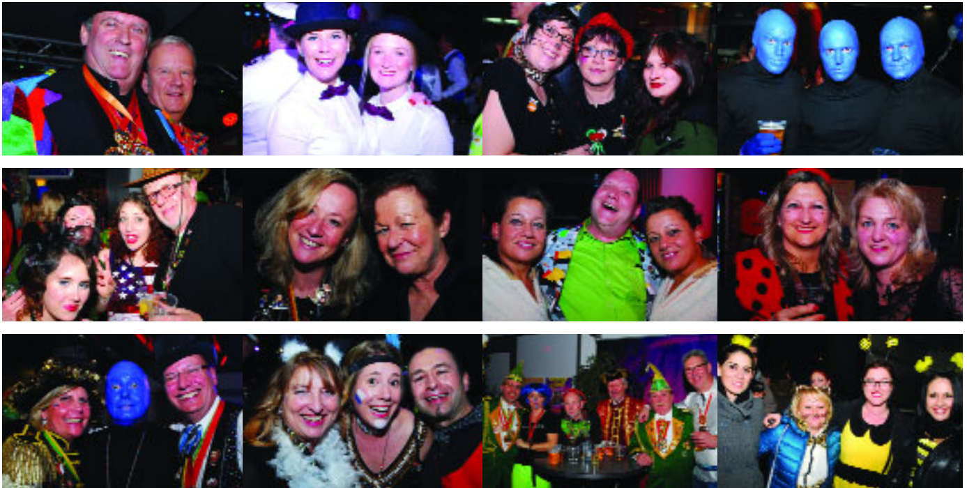
...am 4.2. – Schwerdonnerstag – bei der Sparkassen-Party im Schängel-Center.