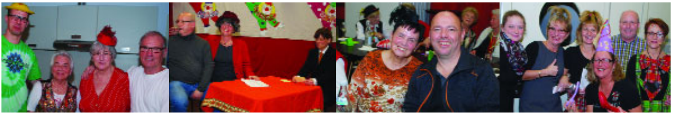
...am 27. Januar beim traditionellen närrischen Nachmittag der kfd-St. Beatus im JuBüZ Karthause.