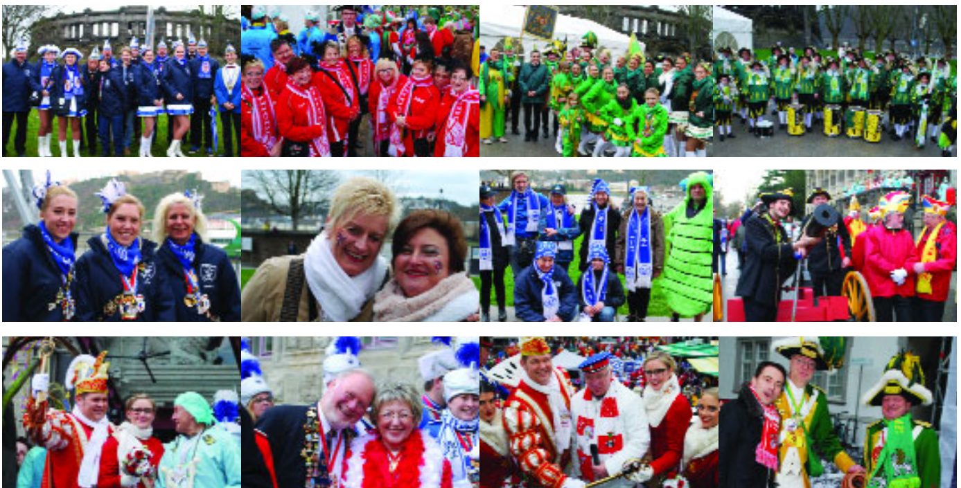
...am 5. Februar bei der Erstürmung der Bundeswehr und des Koblenzer Rathauses.