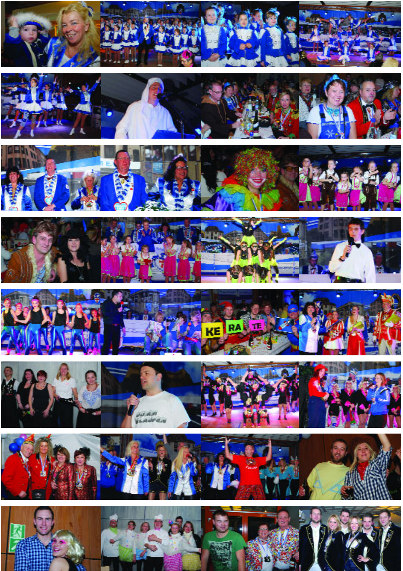
...am 22. Januar bei der 1. Prunksitzung der KG „Blau-Weiß“ Moselweiß in der Aula der Berufsschule.