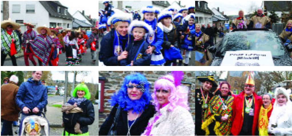
...am 7. Februar beim Karnevalsanzug im „kleinen versoffenen Dorf am Fuße des Berges“, Moselweiß.