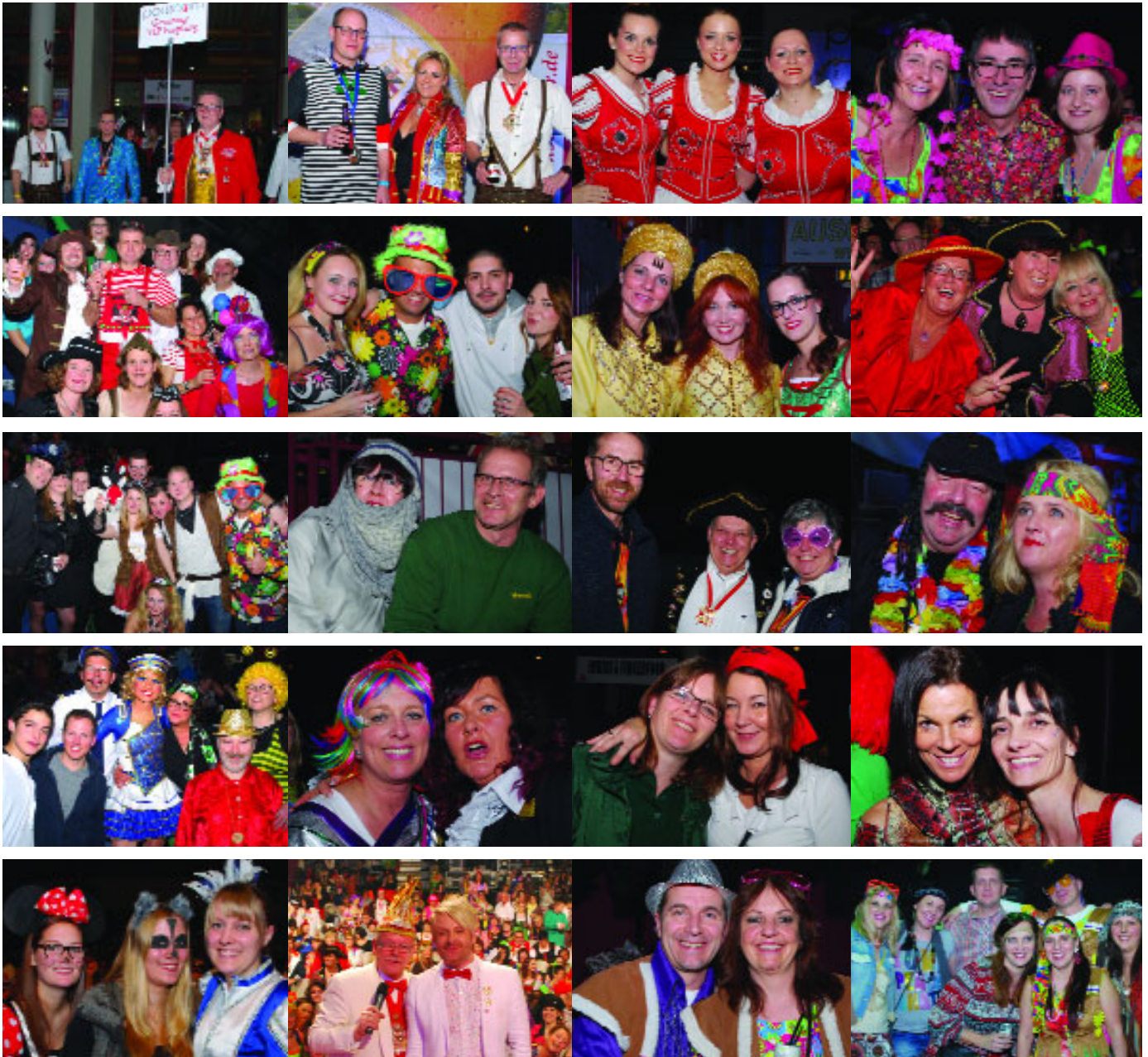
...am 29. Januar bei der Trockensitzung der KK Funken „Rot-Weiß“ Koblenz in der Conlog-Arena.