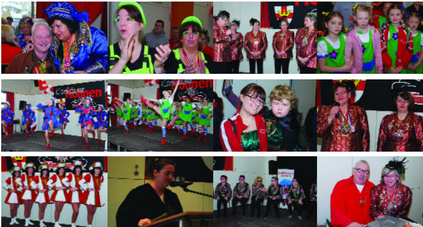
...am 24. Januar beim närrischen Möhnenkaffee der Karthäuser Möhnen im JuBüZ Karthause.