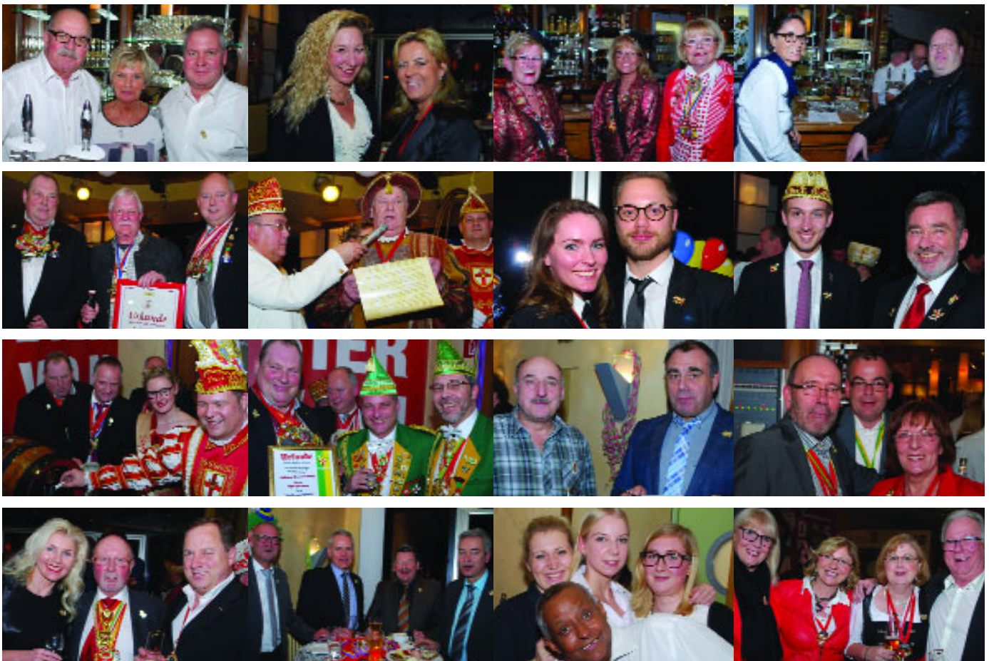
...am 29. Januar beim „Sternewirt“-Empfang der Koblenzer Brauerei im Besucherausschank an der Königsbach.