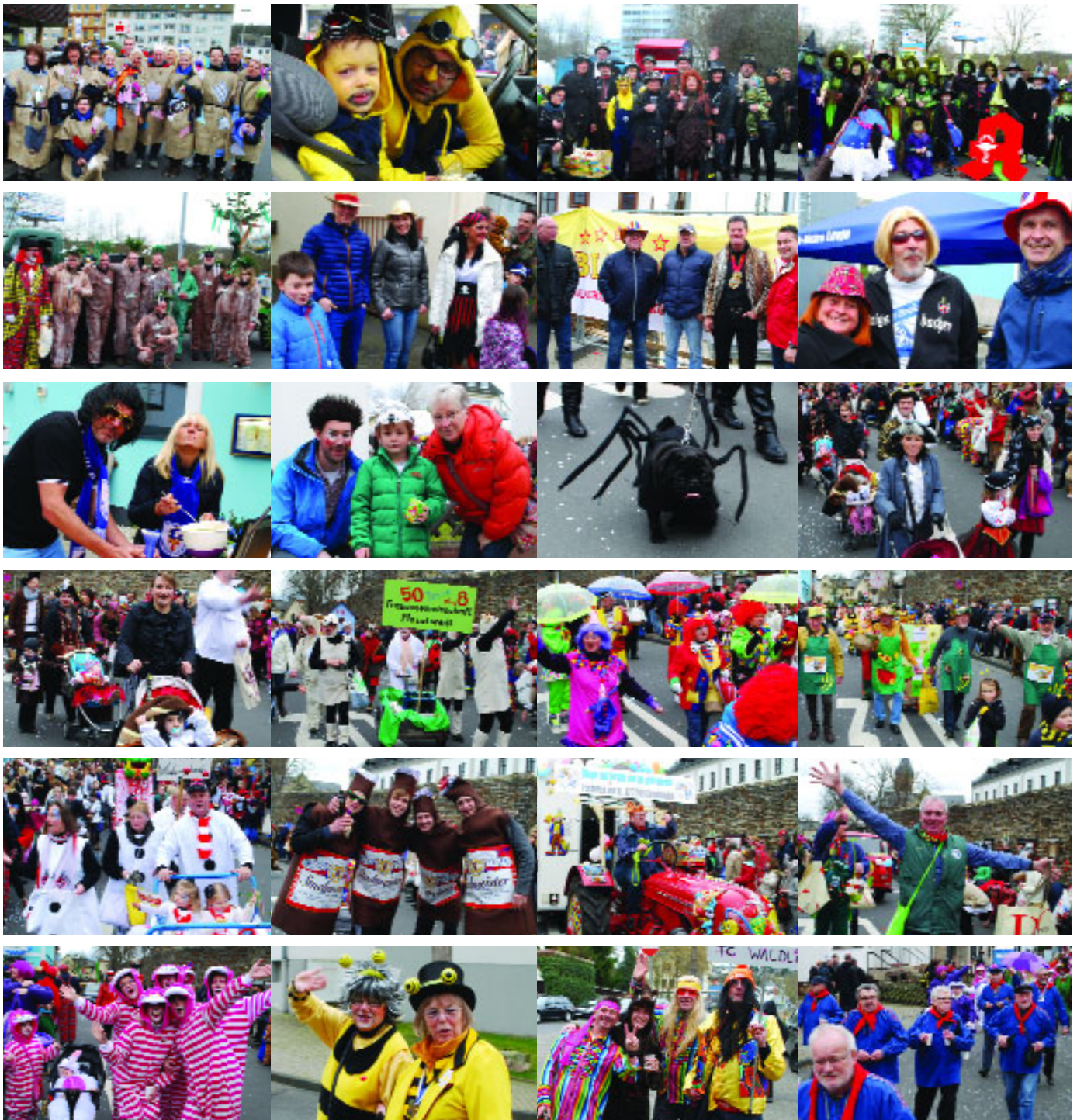
...am 7. Februar beim Karnevalsumzug im „kleinen versoffenen Dorf am Fuße des Berges“, Moselweiß.