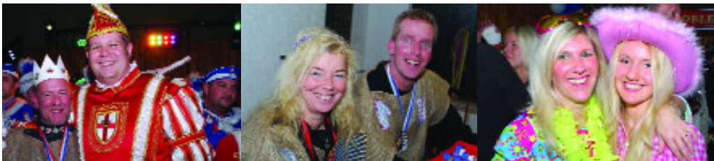
...am 7. Februar bei der „After-Zuch“-Party in der Dr. Josef-Adams-Halle Moselweiß.