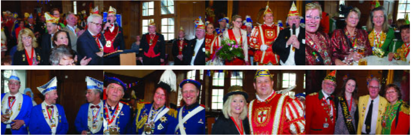
...am 31. Januar beim Karnevalsempfang des Koblenzer Oberbürgermeisters im Rathaussaal der Stadt Koblenz.