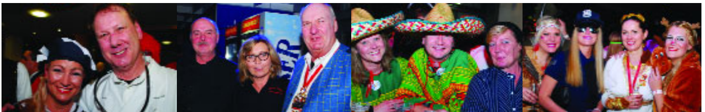
...am 4.2. – Schwerdonnerstag – beim Empfang der Volksbank Koblenz und bei der Sparkassen-Party.