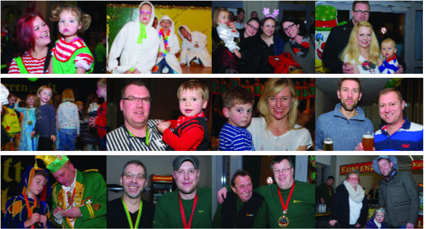
...am 24. Januar bei der Kinderkostümsitzung der Narrenzunft „Grün-Gelb“ in der Aula des Schulzentrums Karthause.