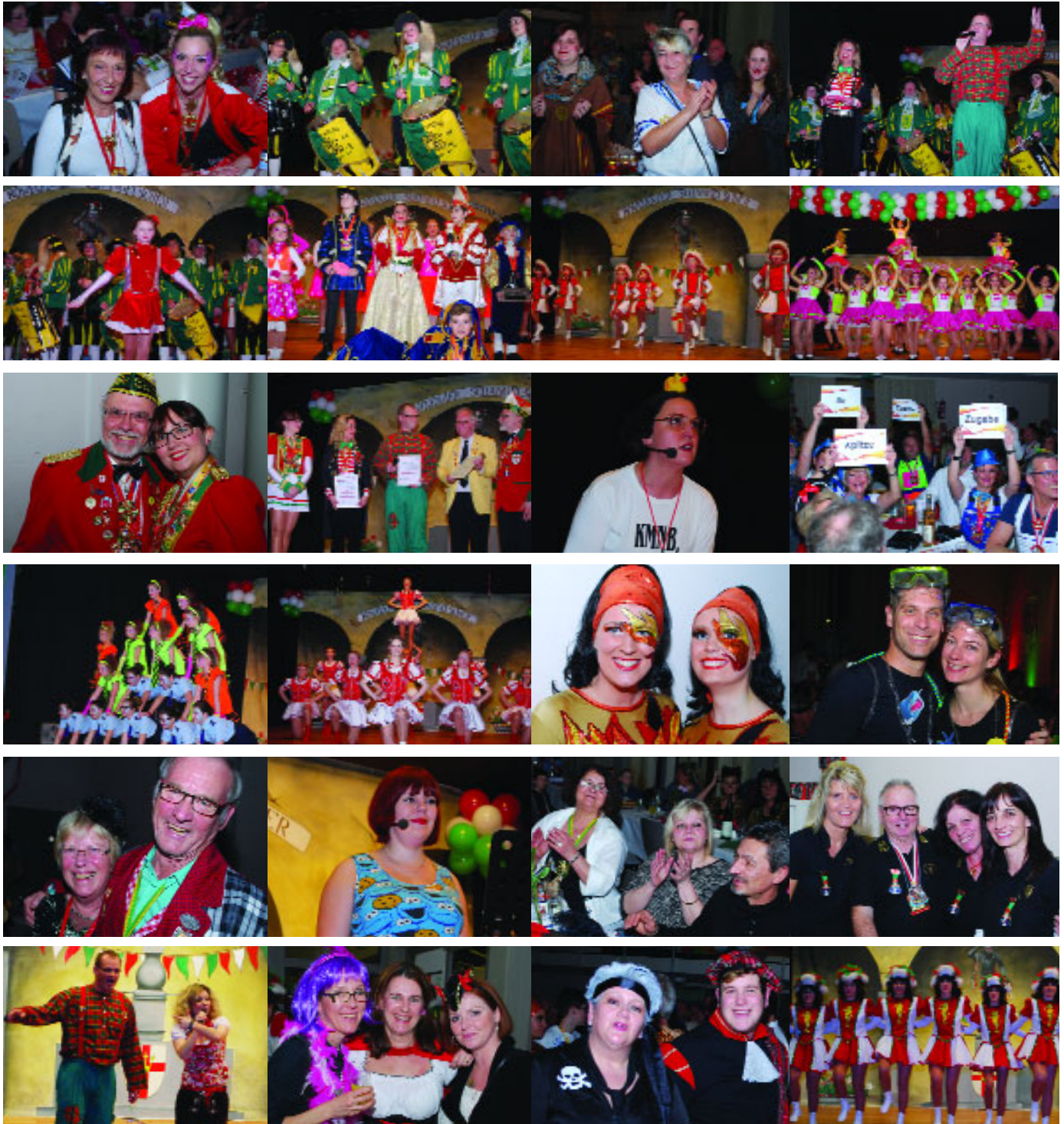
...am 30. Januar bei der „Schängel“-Sitzung der KG Kowelenzer Schängelcher in der Aula des Schulzentrums Karthause.