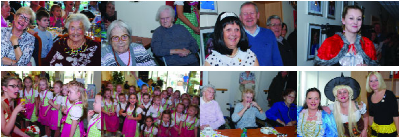
...am 28. Januar bei der Karnevalsfeier der Seniorenresidenz Moseltal in Moselweiß.