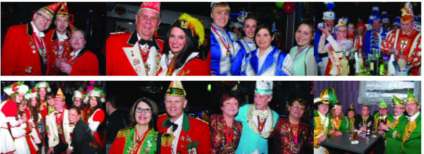
...am 27. Januar beim „Agostea“-Empfang in der Koblenzer Nachtarena „Agostea“ Koblenz.

VON DER KARTHÄUSE IN DIE KOBLENZER STRASSE 236 7 MINUTEN BIS ZUM BESTEN HÖREN Kundenparkplätze direkt am Haus, neben Seniorenresidenz Moseltal