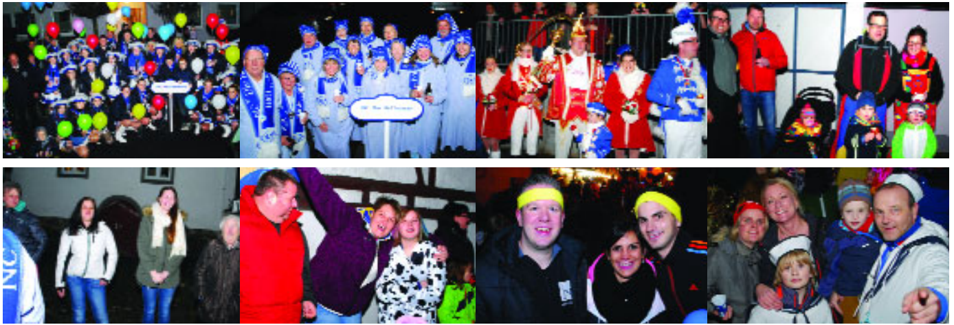
...am 5. Februar beim Abendumzug der „Gülser Husaren“ durch den Stadtteil Güls.